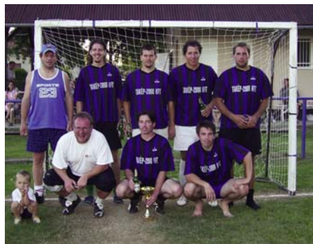
„Vaddisznó” 1. helyezett