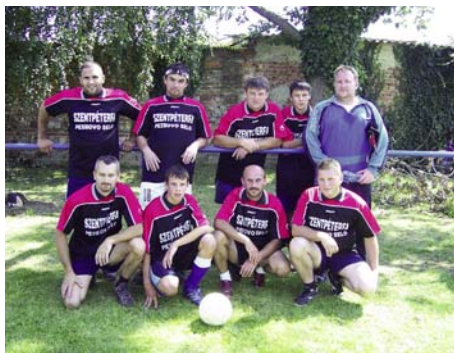
„Szolgálunk és védünk” 2. helyezett