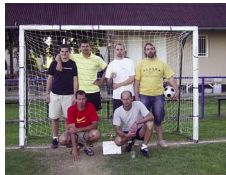
„Nosztalgia” 3. helyezett